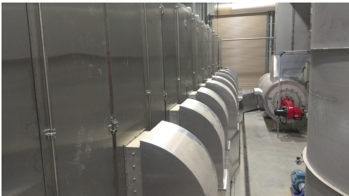
Brenner (rot) mit Brennkammer und anschließendem Zuluftgebläse für den Transport des Heißgases in den Bandrockner