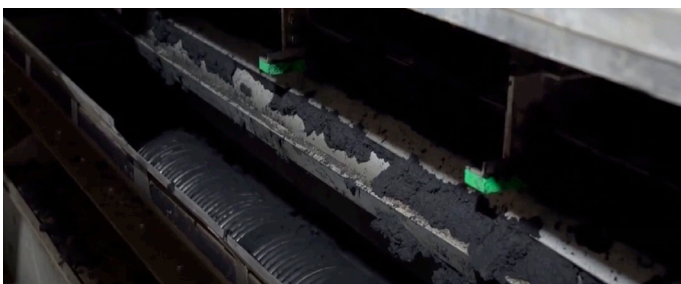
Aufgabereinheit mit Verteilerschlitten und Rollenpresse

In 2018 montierte SEVAR den ersten Bandrockner in Neuseeland, beauftragt von Hawkins Infrastructure . Der Bandrockner der Baugröße BD 3000/11 trocknet 28.000 t/a ausgefaulten, entwässerten Klärschlamm. Der Klärschlamm fällt auf der kommunalen Kläranlage von Whanganui District Council an. Die Kläranlage befindet sich unweit des Tasmansee und des Flughafens. Der Whanganui District Council hat 2016 mit dem Bau der neuen Kläranlage begonnen. Die Fertigstellung erfolgte im Jahr 2018. Die Anlage ist für 40.000 Einwohner sowie einer industriellen Last mit 300.000 EW Anschlussgröße ausgelegt.