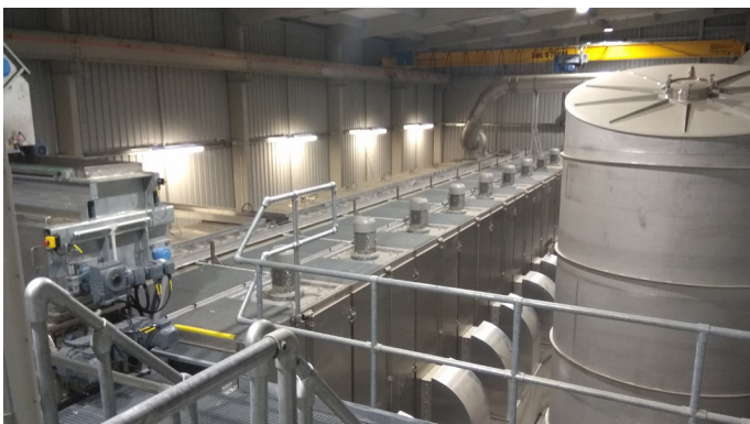
Bandrockner BD 3000/11 mit Verteiler-/Dosiereinheit und Kondensator