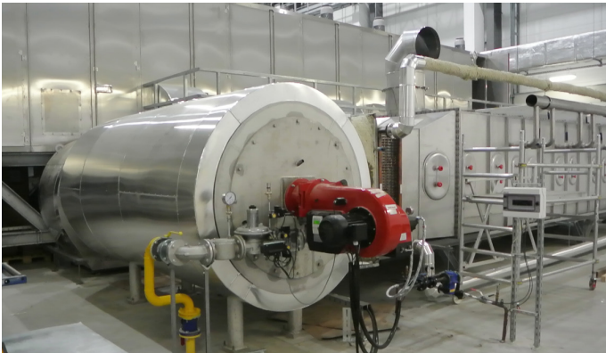
Brennkammer mit Brenner für Erdgas und Gebläse für Verbrennungsluft

Das polnische Wasserwirtschaftsunternehmen Zakład Gospodarki Wodno - Kanalizacyjnej w Tomaszowie Mazowieckim Spółka z o.o. baut und betreibt Wasserversorgungs- und Abwasseranlagen in der Region Łódź. Seit 2000 ist das Unternehmen für die Abwasser- und Schlammbehandlung der Kläranlage verantwortlich. Das polnische Bauunternehmen Budimex S.A. war Generalunternehmer für den Bau der Schlammmentwässerung und -trocknung und Auftraggeber der SEVAR AG.