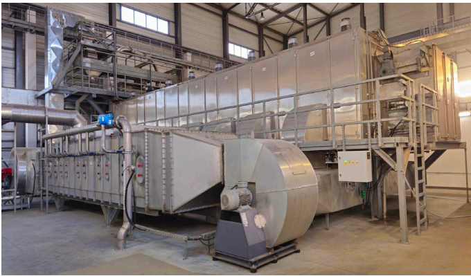
Bandrockner BD 3000/8 mit horizontalem direktem Kondensator und Abluftgebläse

Im Jahr 2015 erfolgte die Inbetriebnahme des Bandrockners BD 3000/8 zur Volltrocknung von unausgefaultem kommunalen Klärschlamm aus der mechnischen und biologischen Behandlungsstufe der Kläranlage der polnischen Stadt Tomaszów Mazowiecki .