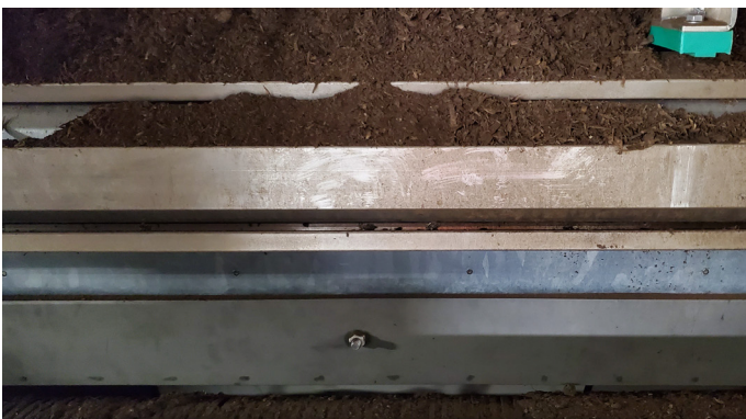
Vorgetrocknetes Material oberhalb der Rollenpresse zur Aufgabe auf das obere Trocknerband

CTBM - Centre de Traitement de la Biomasse de la Montérégie - ist ein Zentrum der organischen Abfallwirtschaft für die Behandlung von flüssigen und halbflüssigen Reststoffen aus der Agrar- und Lebensmittelindustrie in Kanada. Das Zentrum ist mit drei Fermentern und einem Nachvergärer für die Biomethanisierung der biogenen Reststoffe zur Erzeugung von Biogas ausgestattet. Ein Teil des Biogases wird als Energie für das Zentrum verwendet, der andere Teil in das öffentliche Versorgungsnetz eingespeist.