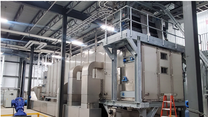
Bandrockner BD 3000/6 mit Aufgabereinheit, Austragsschnecke und Zuluftkanal