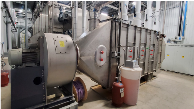
Zuluftgebläse mit horizontalem Kondensator mit Wärmetauscher