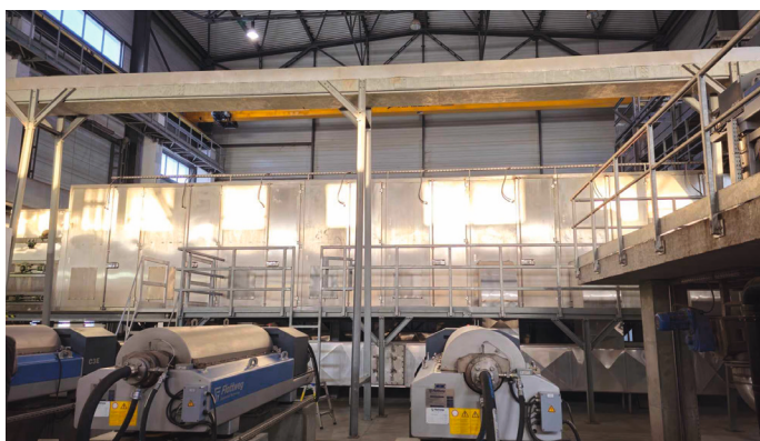
Centrifugeuses de déshydratation sur le côté du sécheur à bande

En 2015, le sécheur à bandes BD 3000/8 a été mis en service pour le séchage complet des boues d'épuration municipales non digérées provenant de l'étape de traitement mécanique et biologique de la station d'épuration de la ville polonaise de Tomaszów Mazowiecki .