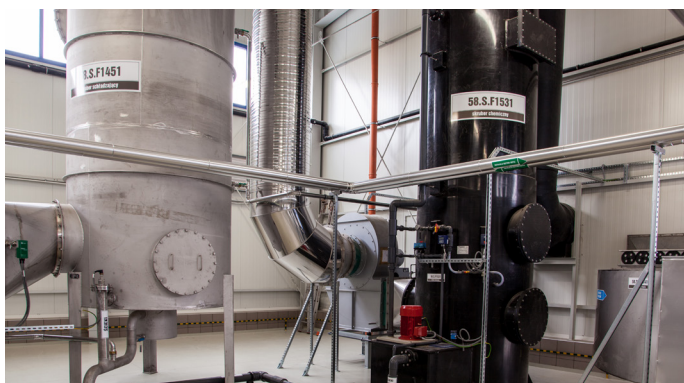
Eaux humides et laveurs acides pour l'air évacué

Les deux lignes du sécheur à bande BD 3000/6 permettent de sécher 24.000 t/a de boues d'épuration digérées avec une teneur en matière sèche d'environ 25% jusqu'à 90% de matière sèche.