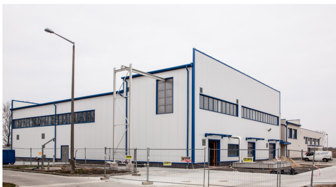
Vue extérieure du bâtiment de traitement des boues

L'eau de refroidissement des centrales de cogénération, chauffée à environ 95 °C, est utilisée dans un système de chauffage indirect composé d' échangeurs de chaleur à faisceau tubulaire pour chauffer l'air de séchage à une température moyenne de 80 °C. En cas de panne de la centrale de cogénération, l'eau chaude est produite par une chaudière au gaz naturel. Dans un système de récupération de la chaleur , l'air humide évacué (environ 60 °C), préchauffe l'air frais entrant dans un échangeur de chaleur et l'air sortant est refroidi à environ 45 °C. Environ 5 à 10 % de l'air vicié est extrait en continu du système de séchage; cet air est entré dans le système en tant qu'air parasite par l'unité d'alimentation du sécheur. L'air évacué (environ 18.000 Nm 3 /h) est traité dans un laveur d'air à fonctionnement direct, puis dans un laveur chimique et un biofiltre. L'eau de lavage du laveur d'air est récupérées à partir de l'effluent de la station d'épuration. Le condensat ou les boues qui en résultent sont envoyés à la station d'épuration d'Opole pour y être traités.