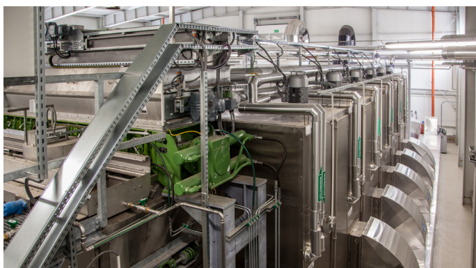
Une ligne du sécheur à bande BD 3000/6 avec unité d'alimentation

En 2013, SEVAR AG a installé deux (2) lignes du sécheur à bande BD 3000/6 avec une capacité d'évaporation d'eau totale de 2.100 kg H 2 O/h dans le bâtiment de traitement des boues de la station d'épuration municipale d'Opole, une ville de Pologne. Les deux lignes peuvent fonctionner indépendamment l'une de l'autre. L'entrepreneur général était la société d'ingénierie polonaise SEEN Technologie .