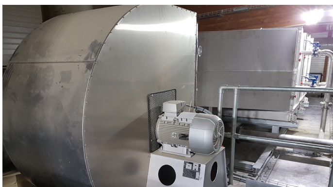
Ventilateur d'extractio d'air