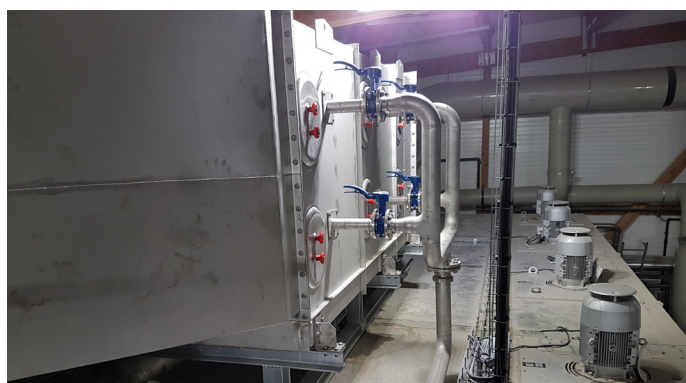
Ventilateur de circulation d'air et condensation