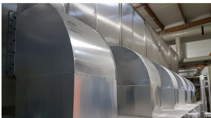
Sécheur à bande BD 3000/7 avec gaines d'évacuation d'air

Le produit séché et broyé à 80-85 % est transporté et stocké dans des bennes par un système de distribution à vis.