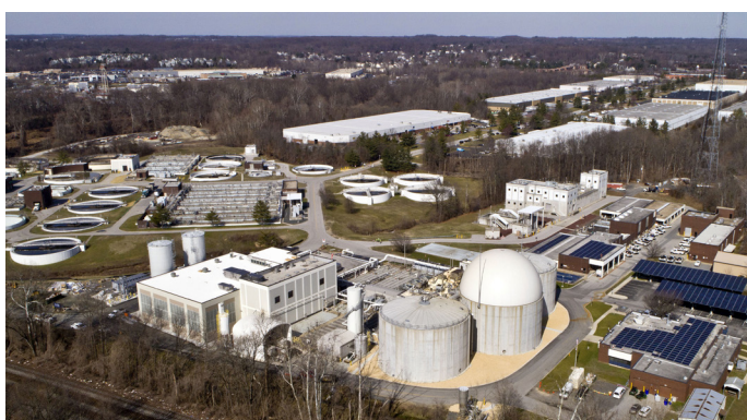
Usine de récupération d'eau de Little Patuxent (LPWRP)

Howard County est l'exploitant l'usine de traitement des eaux usées Little Patuxent Water Reclamation Plant (LPWRP) dans l'État du Maryland, aux États-Unis. Dans le cadre de la modernisation de la station d'épuration, le " Biosolids Belt Drying System " a été installé et est en service depuis janvier 2021.