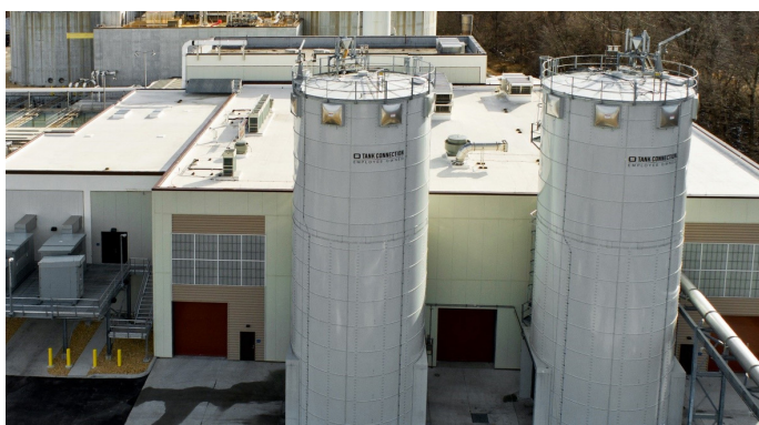
Vue extérieure du bâtiment du sécheur avec 2 silos de produits secs

Le projet " Little Patuxent Water Reclamation Plant Biosolids Processing Facilities Improvements " a été récompensé par l'institut for Sustainable Infrastructure (ISI) en septembre 2021 avec le prix l' Envision Silver Award .