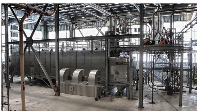
Sécheur à bande (ligne 2) avec mélange en retour

La commande de l'installation de séchage a été effectuée par l'entreprise de construction Clark Construction Group, LLC en février 2017. Les services d'ingénierie du projet d'amélioration des installations de traitement des boues, appelés " Biosolids Processing Facilities Improvement Project " ont été confiés au célèbre cabinet d'architecture et d'ingénierie américain HDR, Inc.