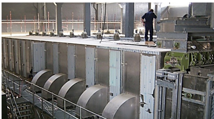
Une ligne du séchoir à bande BD 3000/12 avec unité d'alimentation