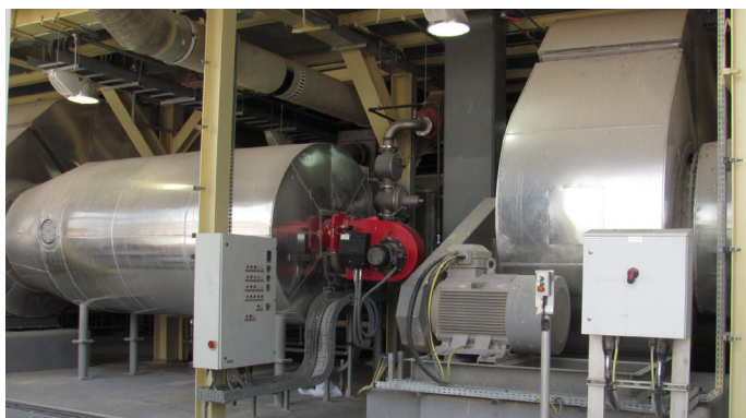
Brûleur (rouge) avec chambre de combustion et ventilateur d'air pulsé

En 2009, SEVAR a été chargé d'installer trois (3) lignes du séchoir à bande BD 3000/12 avec 12 modules de séchage pour les séchage complet de 112.000t/ade boues d'épuration digérées. Les boues d'épuration sont produites dans la station d'épuration municipale de Dubaï, située dans le quartier de Jebel Ali et raccordée à un réseau de 1.500.000 équivalents habitants. Le produit séché conditionné est en sachet et utilisé comme engrais. L'exigence concernant les boues séchées était de produire un produit sec granuleux avec une faible formation de poussière .