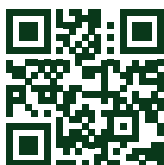
SCHÉMA DE L'USINE