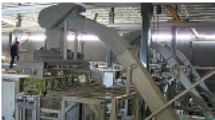
Convoyeur à chaîne pour boues d'épuration déshydratées vers l'unité d'alimentation (3x)